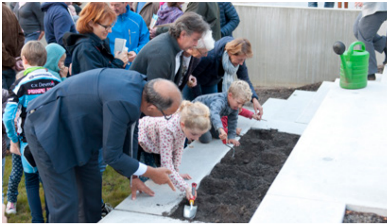
De bollenplant-actie ingezet door de burgemeester en schepenen vergezeld door de kinderen van Terlanen

De inhuldiging van het plein op 1 oktober werd een succes, mede dankzij de gewaardeerde medewerking van de fanfare en BCTO, de basketclub. De beplantingen langs de betonnen elementen en in de open ruimtes zijn voorzien voor medio december. Ondertussen werd ook een schuifaf geïnstalleerd op het middenplein. Op de volgende vergadering zal de dorpsraad bespreken of aan het plein zelf (niet aan de Kapelleweg) een nieuwe naam moet gegeven worden.