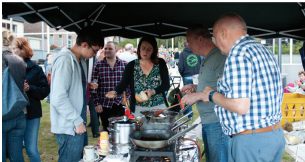
Uiteraard werd er vanuit de Dorpsraad een 'Glas Bubbels' en een 'Broodje worst' aangeboden aan iedereen!