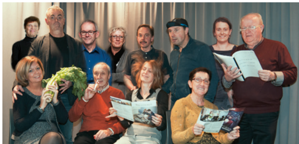
Op vrijdag 6 januari 2017 om 20u (alleen toneel), zaterdag en zondag 7 en 8 januari 2017 om 18u in DEN TURF te TERLANEN, muziek en toneel avonden van KF Sint Michaël Terlanen.