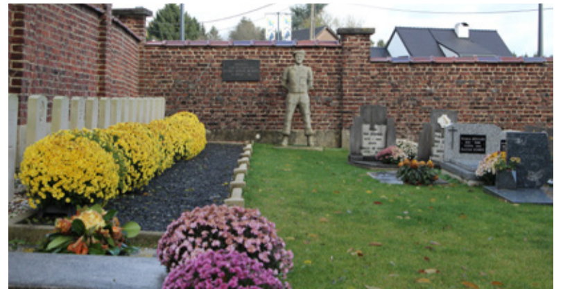
Een zicht op het vernieuwde kerkhof, in het groen aangelegd.

Het proefproject rond het groen kerkhof wordt algemeen geprezen en op prijs gesteld : het kerkhof ligt er veel mooier bij dan vroeger en de groene stroken worden door de gemeente regelmatig onderhouden. Vanuit de werkgroep 'Trage Wegen' wordt gesuggereerd om te polsen of de families waarvan een graf er wat scheef of verzonken bij ligt niet samen een vakman kunnen aanspreken om dat te verhelpen. Ook wordt er aan gedacht om wetenswaardigheden en verhalen over de overledenen te verzamelen en op te tekenen, zodat die bewaard kunnen worden. De Dorpsraad spreekt graag haar steun uit voor dit project.