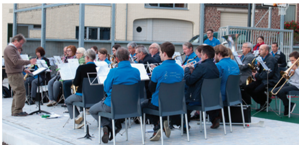
De inhuldiging van het vernieuwde plein werd opgeluisterd door de Koninklijke Fanfare Sint Michaël.

vrijdag 21, zaterdag 22 en zondag 23 stapweekend Peer, KVLV