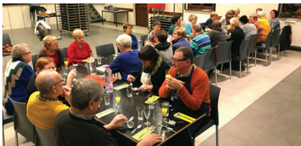
Een leuke reeks kookworkshops bij KVLV werd afgesloten begin december, voor herhaling vatbaar was de boodschap van de deelnemers.