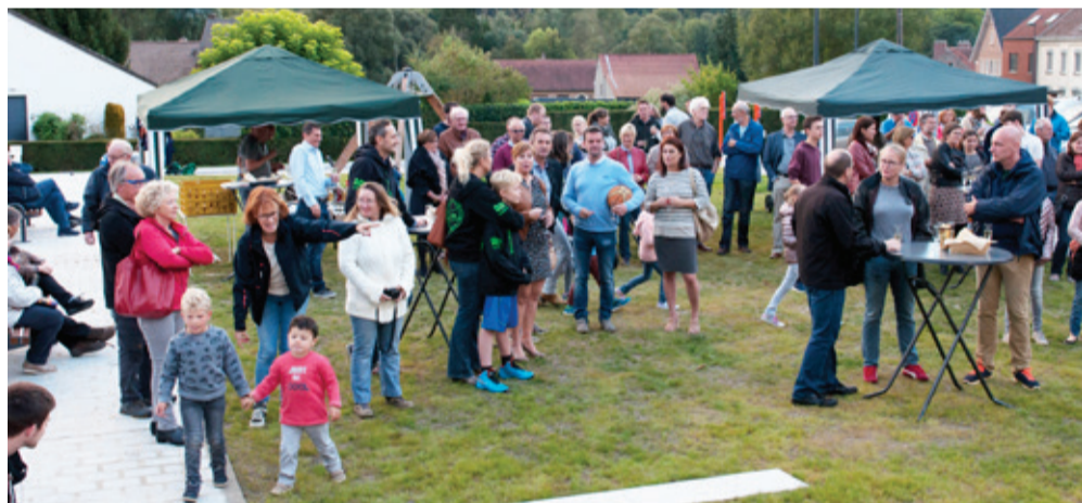
Leuk was het om veel mensen te zien verschijnen op een niet alledaagse gebeurtenis 'Het openen van een plein in je dorp'.