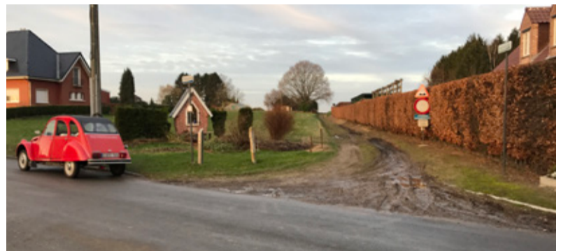
Het kruispunt aan de Bollestraat en de Moskesstraat waar het fietspad het Terlanenveld indukt.

Het openbaar onderzoek is thans afgehandeld. Er werden vier bemerkingen/bezwaren ingediend waarover de bevoegde gemeentediensten zich thans buigen. Mogelijk komt er ook overleg met de indieners van deze bemerkingen en bezwaren. Nadien wordt het dossier opnieuw voorgelegd aan het college van burgemeester en schepenen. Indien de oorspronkelijke timing kan aangehouden worden zal het fietspad gedurende 2017 aangelegd worden.