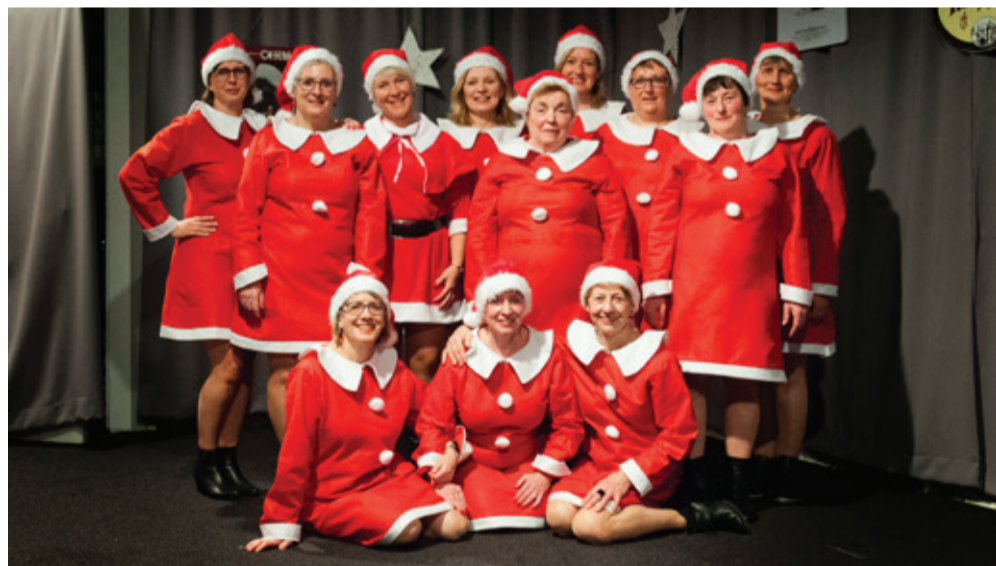
Het ledenfeest bij KVLV Terlanen was zoals op de foto te zien volledig in het teken van Kerstmis. Sketches muziek en lekker eten wisselden mekaar af tot een geslaagde avond.