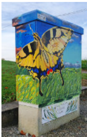
#toureleentrik in Terlanen