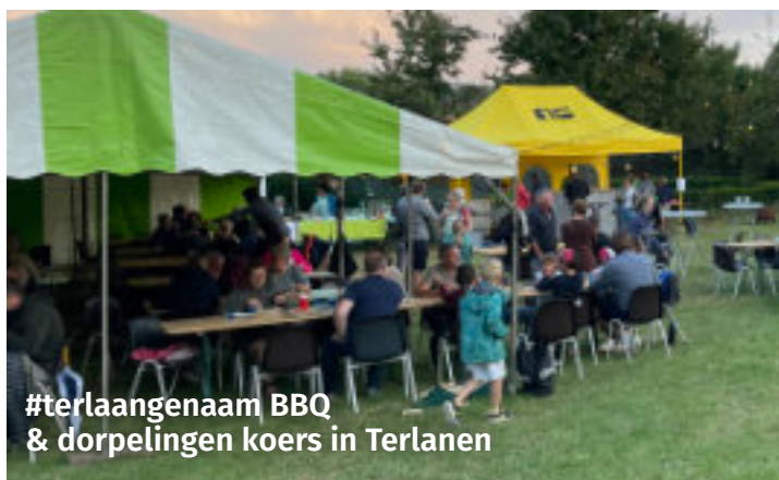
#terlaangenaam BBQ & dorpelingen koers in Terlanen