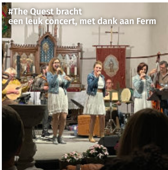
#The Quest bracht een leuk concert, met dank aan Ferm