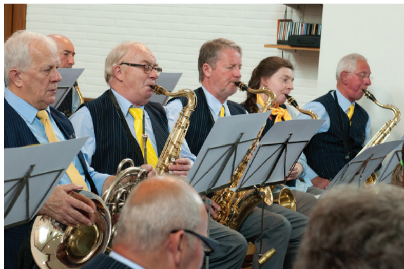
De muzikanten van de Koninklijke Fanfare Sint Michaël gaven een leuk lenteconcert, we zien hier vlnr: de alt saksen, de trompetisten en de tenor saksen.