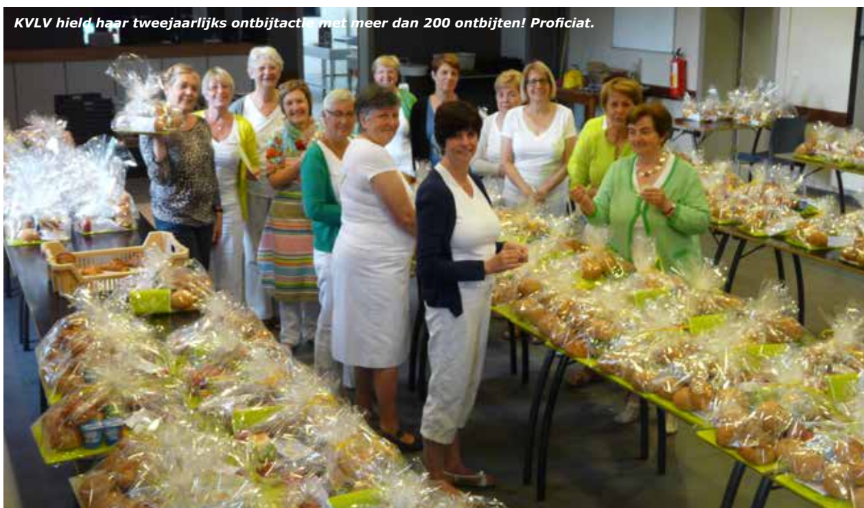
KVLV hield haar tweejaarlijks ontbijtactie met meer dan 200 ontbijten! Proficiat.