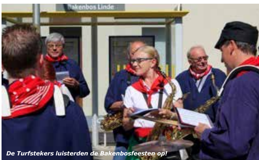
De Turfstekers luisterden de Bakenbosfeesten op!