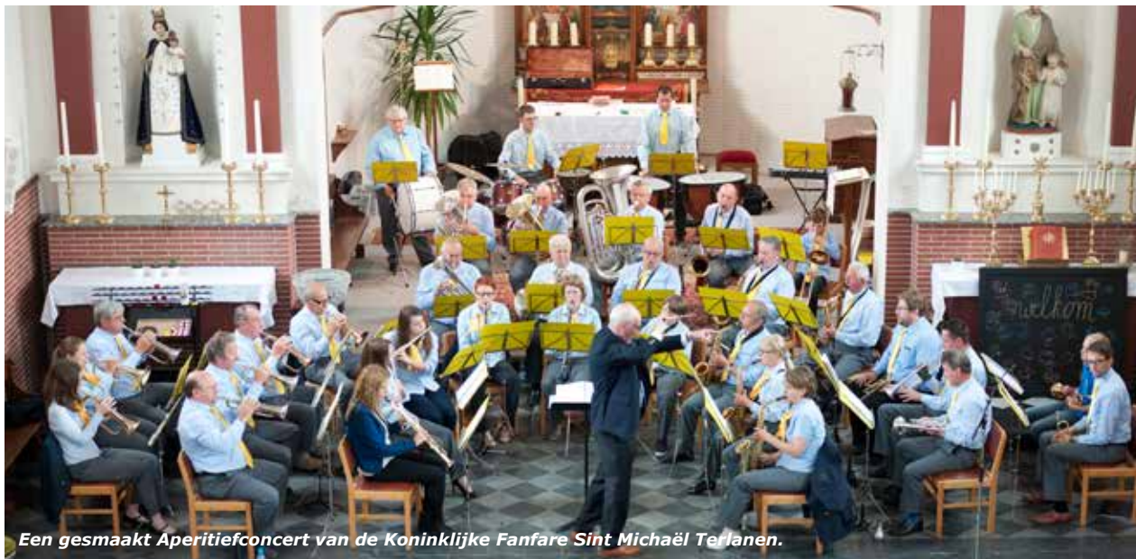
Een gesmaakt Aperitiefconcert van de Koninklijke Fanfare Sint Michaël Terlanen.

Zaterdag 24 18:00 gebedsdienst opgeluisterd door Cantuva, Parochie, St. Michielskerk Terlanen