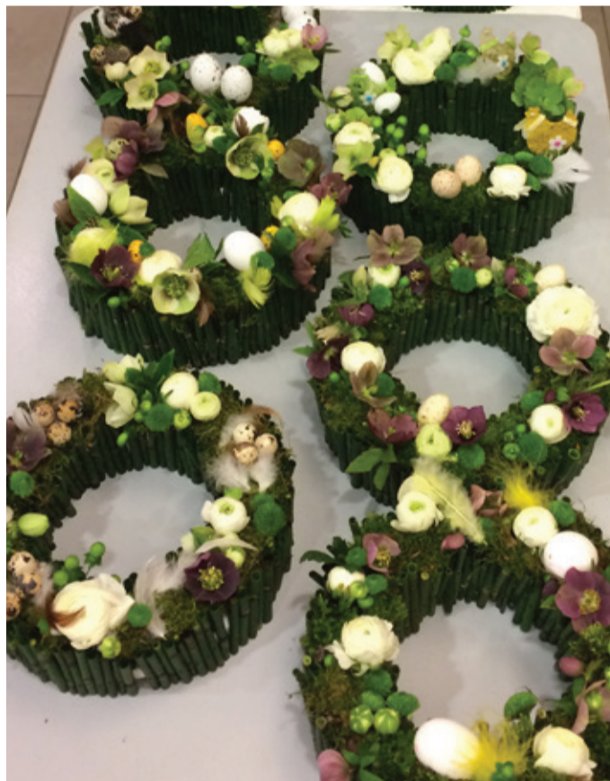
Leuke activiteit van KVLV met hierboven de resultaten van de deelnemers aan het bloemschikken in voorbereiding van het Paasfeest.