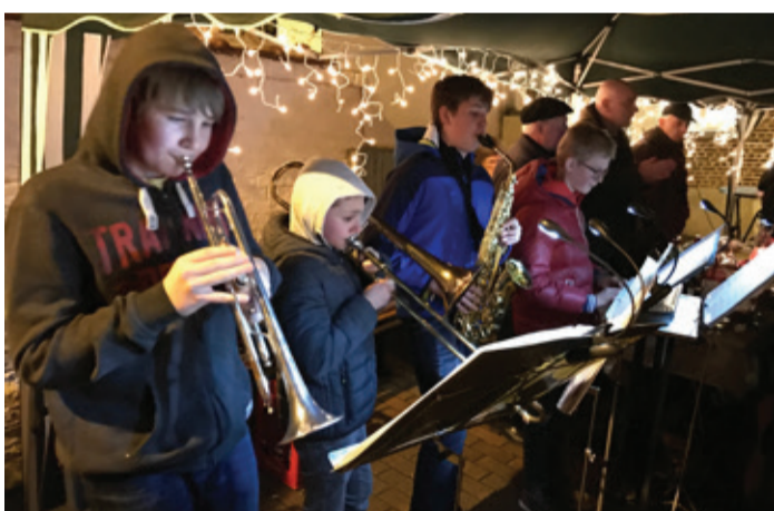
Ook dit jaar hadden we een gezellige nieuwjaarsdrink in januari. De plaatselijke band, 'De Lanefreaks' bestaande uit Terlaanse jongeren bracht hier weer een paar sfeervolle momenten met hun mooie melodieën.