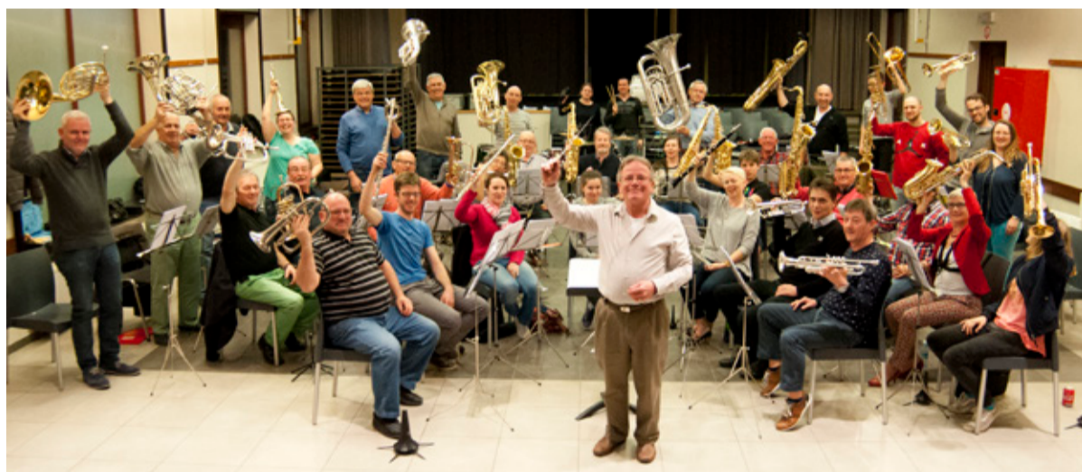
De enthousiaste muzikanten van de Fanfare Sint Michaël Terlanen op een van hun repetities voor de Paasmis volgende week en het aankomende concert op 21 mei in die zelfde Sint Michielskerk te Terlanen.