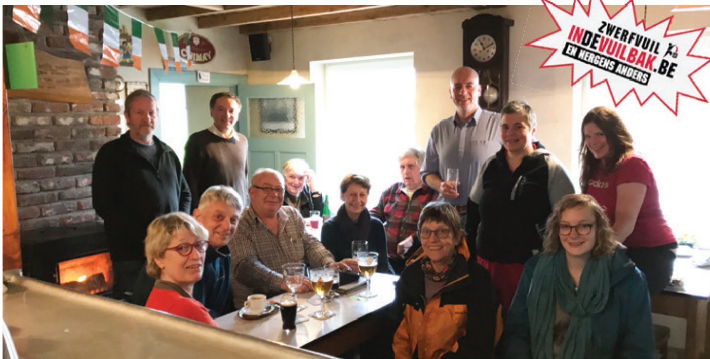
Het moeten niet altijd de volle vuilzakken zijn die in beeld komen. Dit is een greep uit de groep van 20 deelnemers aan de opruimactie in Terlanen. Dit om andermans achtergelaten vuil op te ruimen. Chapeau en respect!