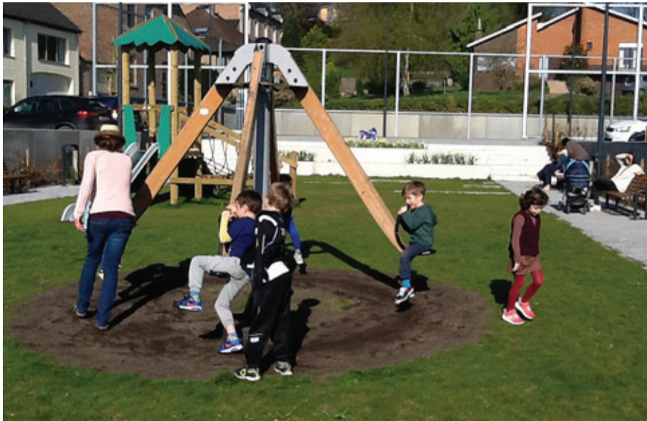
Het vernieuwde plein met zijn speeltuigen is geen maat voor niets! Kinderen profiteren ervan met volle teugen terwijl de ouders even genieten van de zon en de Paaslelies die tijdens de Winterkermis geplant werden.