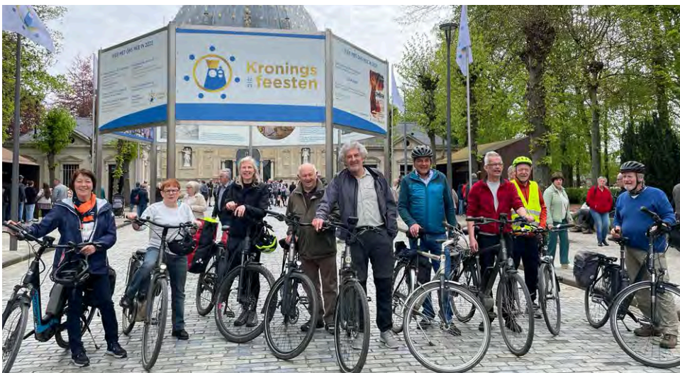
Ook dit jaar een sportieve activiteit, met de fiets naar Scherpenheuvel. De innerlijke mens was ook belagrijk uiteraard.