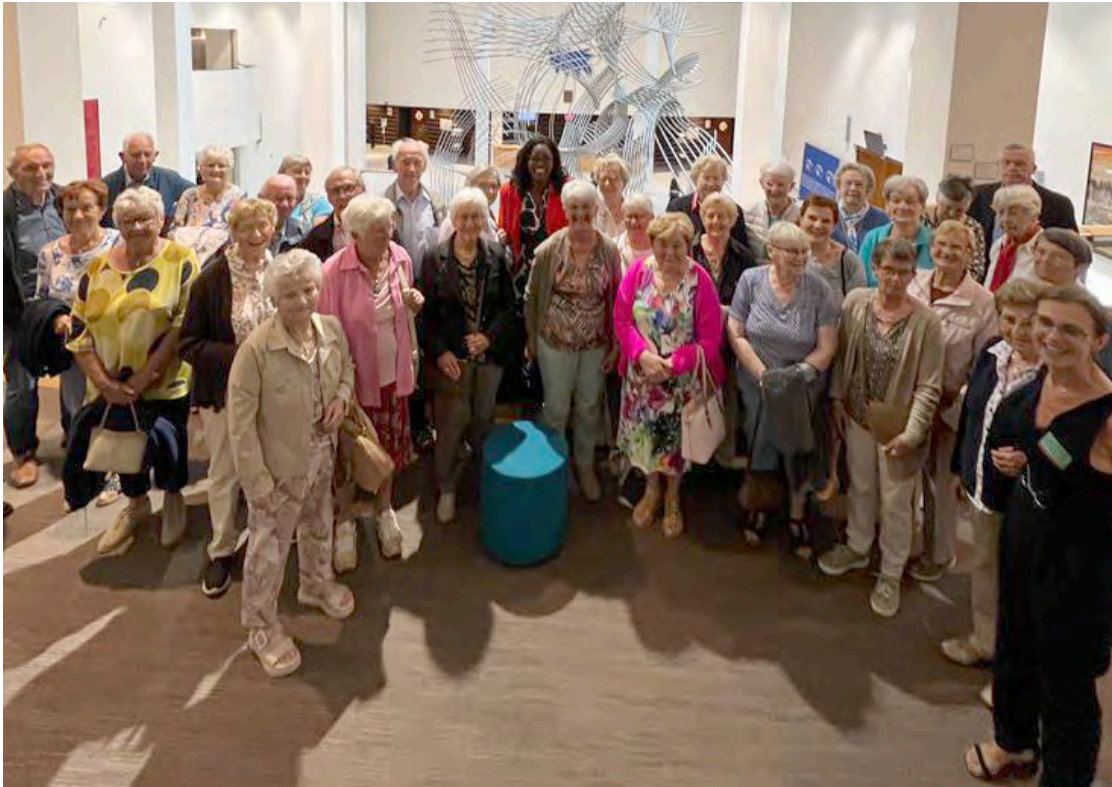
Bond 3 x 20 ging op bezoek naar het Europees Parlement