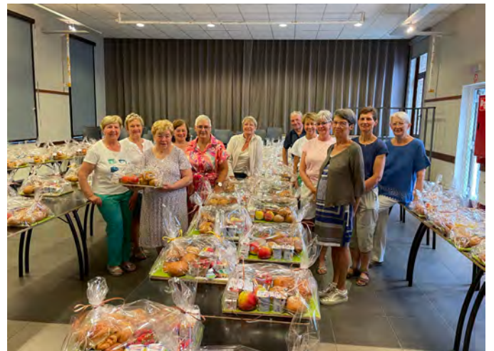
Ferm heeft weer voor een flink ontbijt gezorgd in Terlanen.