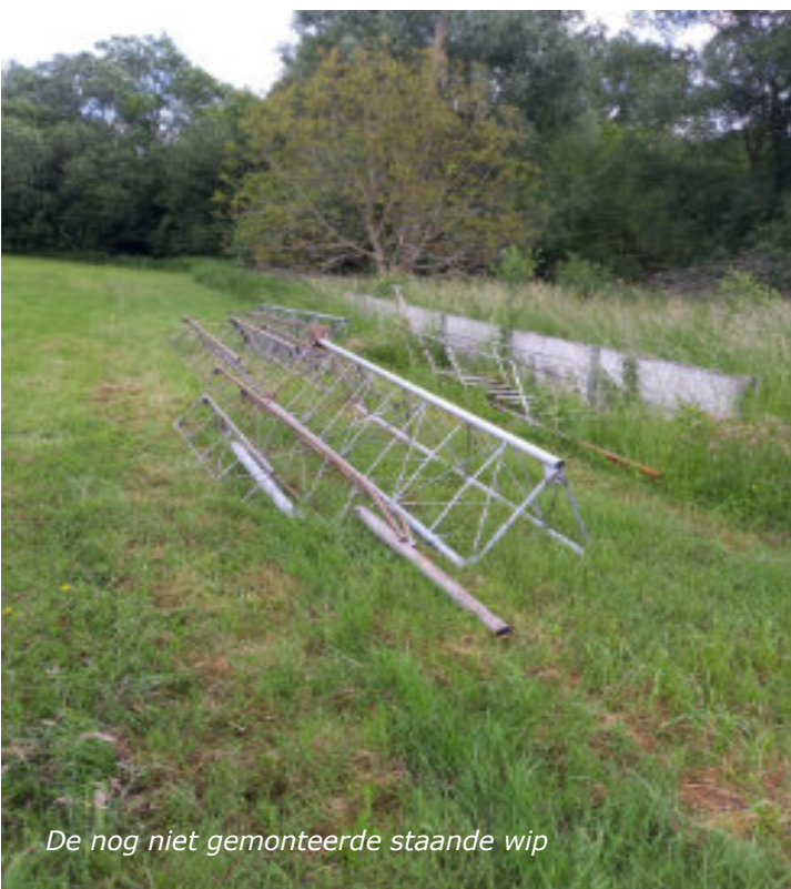
De nog niet gemonteerde staande wip