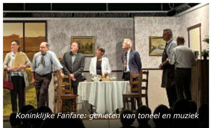
Koninklijke Fanfare: genieten van toneel en muziek