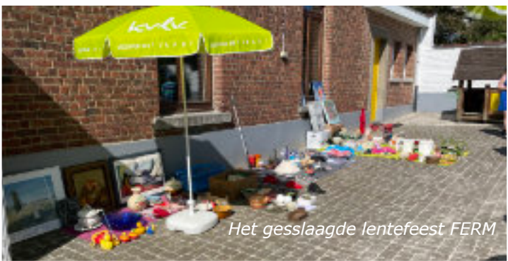
Het gesslaagde lentefeest FERM