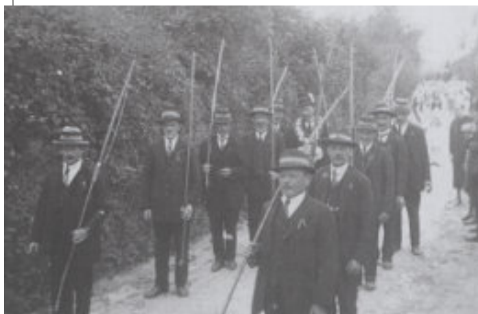
De vrouwen en mannen van de Sint-Sebastiaansgilde van Terlanen, anno 1930. De vrouwen dragen de pijlen, de mannen de bogen.

De hoogdag van elke schuttersgilde is het jaarlijkse schuttersfeest, ook wel Koningsschiëting genoemd.