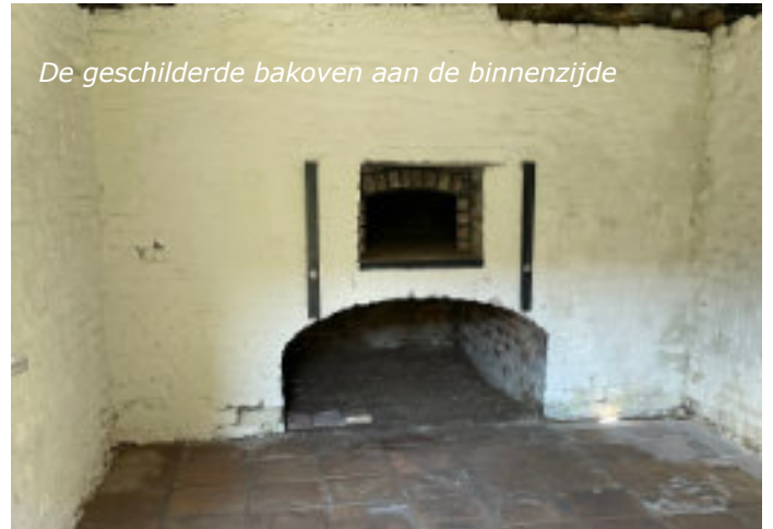
De geschilderde bakoven aan de binnenzijde