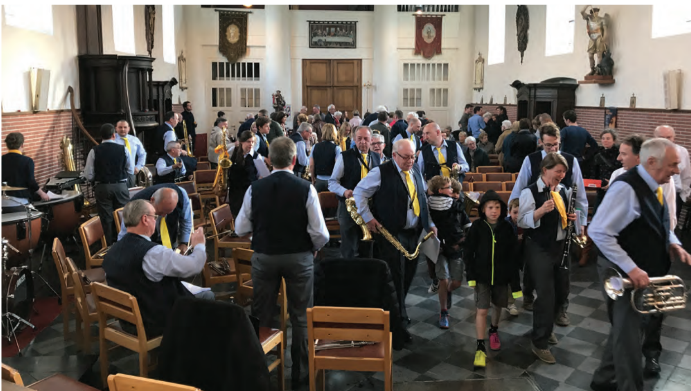
Ook dit jaar gaf de Koninklijke Fanfare Sint Michaël een mooi, gevarieerd en goed bijgewoond Lenteconcert op 21 mei in de Kerk te Terlanen.

Ben je actief op 's werelds grootste sociale netwerk en wil je meer weten over wat er reilt en zeilt in Terlanen? Vind dan onze pagina www.facebook.com/Terlanen leuk en laat iets achter op ons prikbord. Scan de QR-code hiernaast en ga rechtstreeks naar onze pagina!