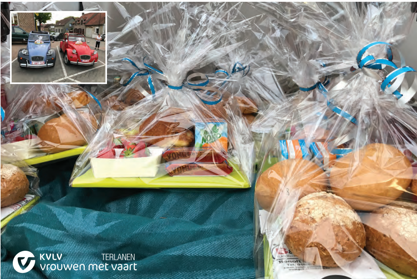
KVLV Terlanen bezorgde op vaderdag 10 juni weer 225 ontbijten aan huis! Van een geslaagde actie gesproken wetende dat er in Terlanen ± 300 brievenbussen zijn!