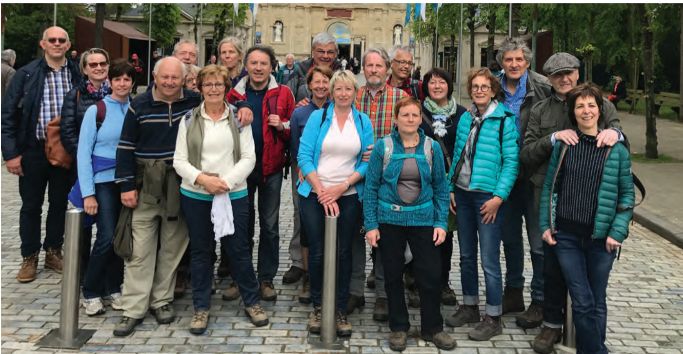
Op 1 mei trokken een paar dapperen te voet naar Scherpenheuvel vanuit Terlanen (50 km), een deel pikte in aan het station in Leuven (35 km) en een laatste deel aan het Kasteel van Horst (15 km). Proficiat aan de dapperen.