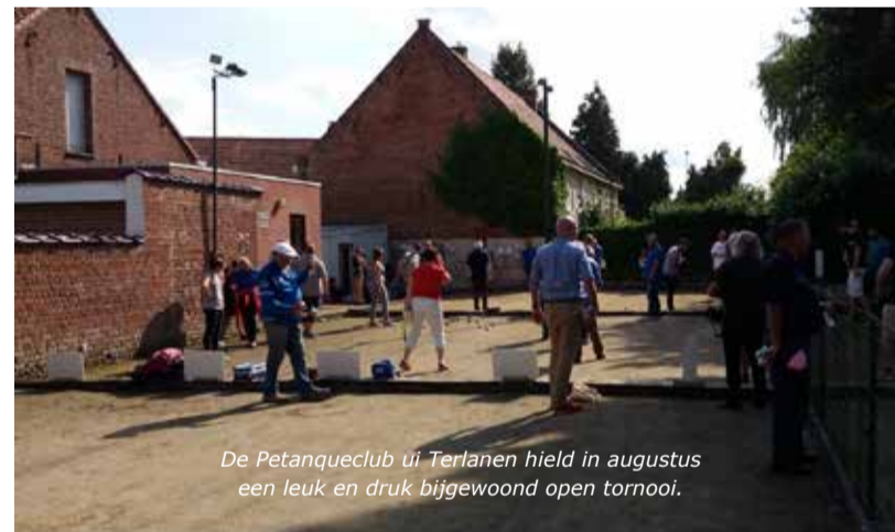
De Petanqueclub uit Terlanen hield in augustus een leuk en druk bijgewoond open tornooi.