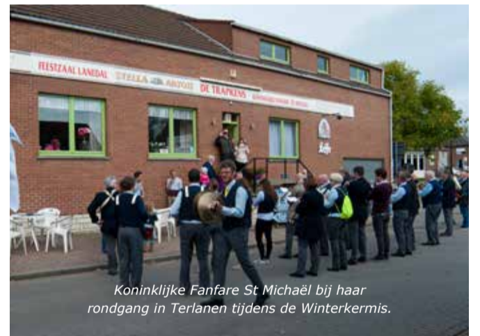
Koninklijke Fanfare St Michaël bij haar rondgang in Terlanen tijdens de Winterkermis.