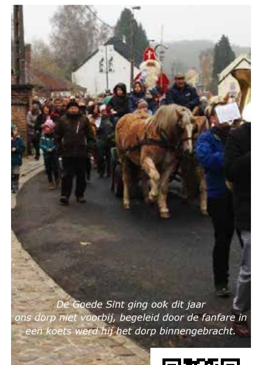
De Goede Sint ging ook dit jaar ons dorp niet voorbij, begeleid door de fanfare in een koets werd hij het dorp binnengebracht.

Ben je actief op 's werelds grootste sociale netwerk en wil je meer weten over wat er reilt en zeilt in Terlanen? Vind dan onze pagina www.facebook.com/Terlanen leuk en laat iets achter op ons prikbord. Scan de QR-code hiernaast en ga rechtstreeks naar onze pagina!