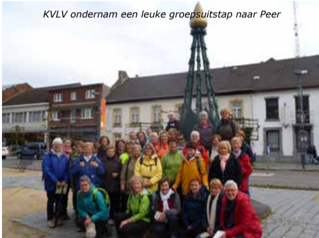
KVLV ondernam een leuke groepsuitstap naar Peer

vrijdag 20, zaterdag 21 en zondag 22 stapweekend Lobbes, KVLV