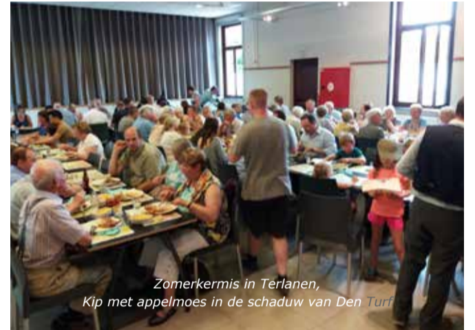
Zomerkermis in Terlanen, Kip met appelmoes in de schaduw van Den Turf