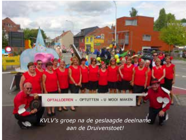
KVLV's groep na de geslaagde deelname aan de Druivenstoet!