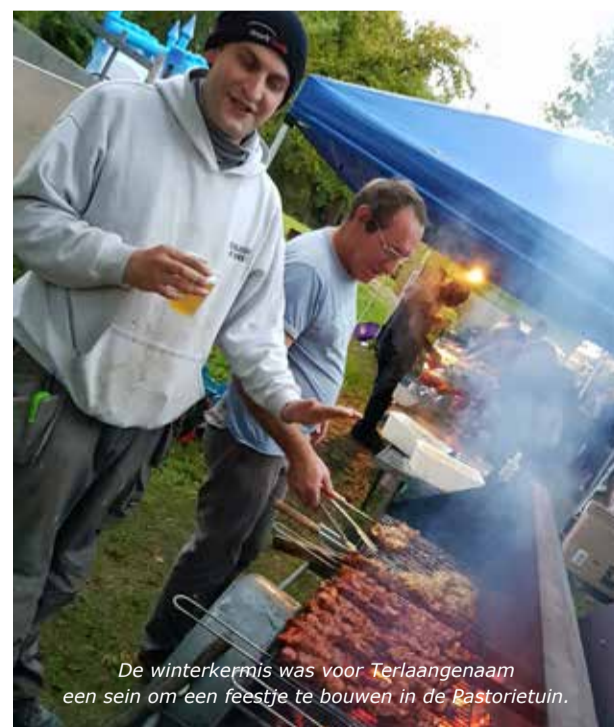
De winterkermis was voor Terlaangenaam een sein om een feestje te bouwen in de Pastorietuin.