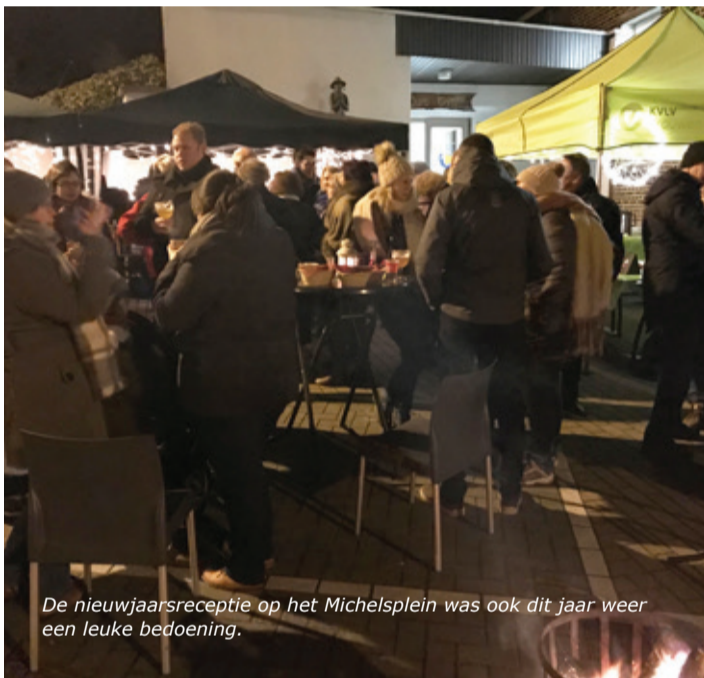
De nieuwjaarsreceptie op het Michelsplein was ook dit jaar weer een leuke bedoening.

zaterdag 04 09u - 17u Vissershof, Lanevissers, Neerijse Zaterdag 5 en zondag 6 Open Petanquetornooi, inschrijven tot 13u15, zaterdag Doubletten en zondag Tripletten, Petanqueclub De Turfspelers Terlanen Zaterdag 18 08u -16u30 6de vis wedstrijd, Lanevissers, vijver Leuvensestraat Zondag 26 deelname druivenstoet Overijse, Kon. Fanfare St. Michaël Terlanen en KVLV