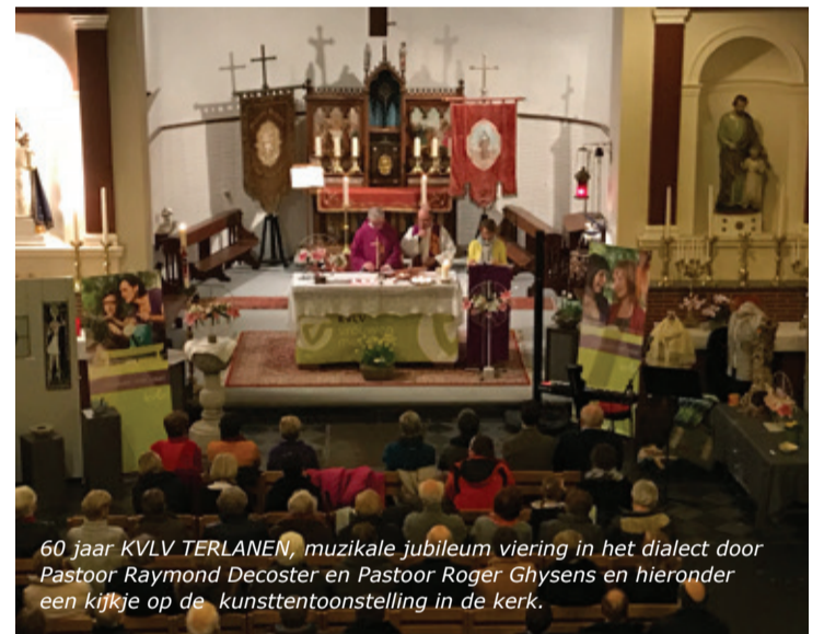
60 jaar KVLV TERLANEN, muzikale jubileum viering in het dialect door Pastoor Raymond Decoster en Pastoor Roger Ghysens en hieronder een kijkje op de kunsttentoonstelling in de kerk.