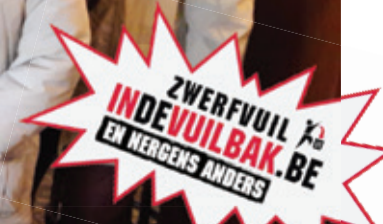
Het moeten niet altijd de overvolle vuilzakken zijn die in beeld komen. Dit is een greep uit de groep van 19 deelnemers aan de opruimactie in Terlanen, en dit om andermans achtergelaten vuil op te ruimen. Chapeau en respect voor deze vrijwilligers!